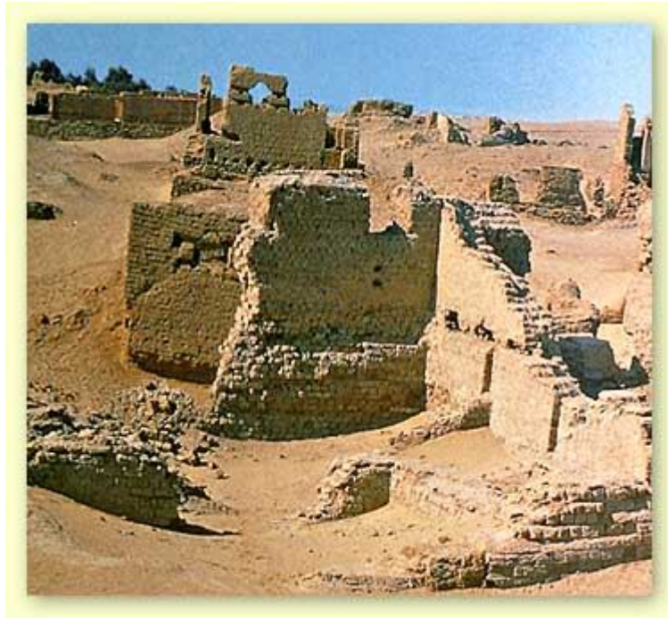
أطلال مدينة كرانيس

وهي تمثل أطلال مدينة ( باكخياس) الرومانية القديمة وكانت مركزاً للوحي، وبها معبد مبنى بالطوب اللبن ومجموعة من المنازل، وتقع على بعد 8 كم شرق مدينة كرانيس.