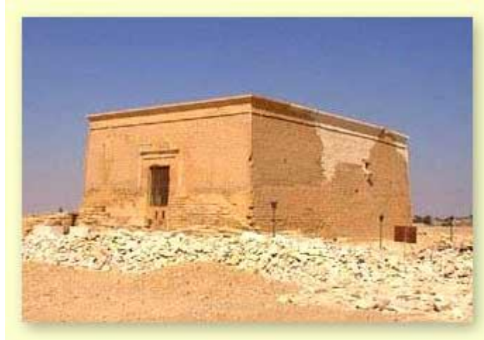
معبد قصر قارون

يقع على الطرف الجنوبي الغربي لبحيرة قارون على بعد 50 كم من مدينة الفيوم ولا يزال المعبد يحتفظ بجميع تفاصيله وشكله العام ويزين مدخله قرص الشمس كما تزين مداخله رسوم بارزة، وقد تأسست مدينة ديونسياس فى القرن الثالث، وإزدهرت فى العصر الروماني، وبالمنطقة بقايا قلعة دقلاطيان