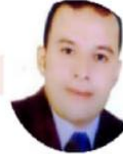
أ.د. محمد دسوقي