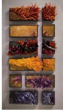
شكل رقم (3)

http://www.bluffton.edu/courses/womenartists/WomenArtistsPw/bontecou/bontecou.html