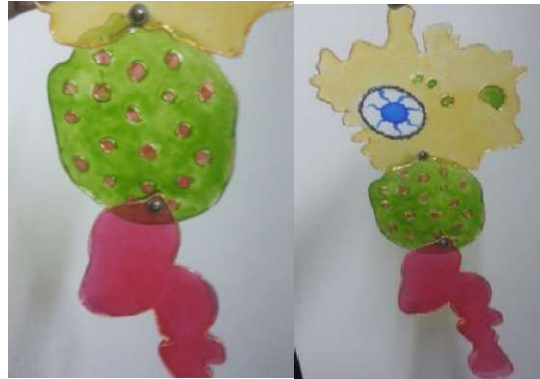
شكل رقم (5)

العروسة تشبه الحيوان له رأس يخرج منها ندبات والجسم دائري الشكل ينتهي بالارجل وهي منفذه بنفس طريقة العروسة الحمامه من خلال تحديدها بقلم الرليف وتلوينها بالوان الزجاج.