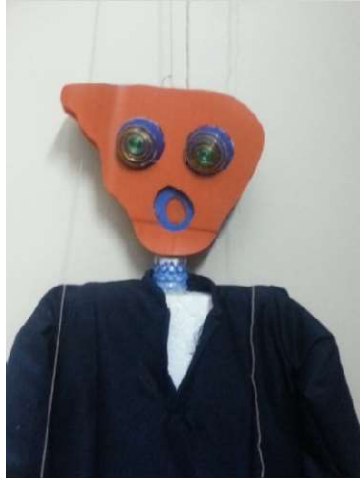
شكل رقم (4)

عبارة عن عروسة ماريونيت نفذت الرأس من شرائح البلاستيك باللون البرتقالي والأزرق علي هيئة طبقات يفصل كل طبقة عن الأخرى سنتيمتر لإبراز تجسيمها وتميزت العروسة بكبر حجم العيون ووضوحها وهي عبارة عن نصف كرة زرقاء والتشكيل فوقها بالأسكبيدو الأصفر والأخضر ويبدو الفم من خلال تفرغ طبقتين من الشرائح لتحقيق العمق في الفم ويتحقق الجانب الجمالي في العروسة من خلال ثني الشرائح البلاستيك في اعلي يسار الرأس ويتم اضافته المكملات للعروسة كالملابس وتميزت العروسة بصراحة الوانها ووضوحها.