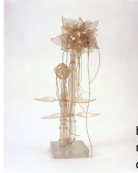
شكل رقم (2)

عمل الفنان Lee Bontecou من الأنابيب البلاستيك والأكريليك البوليوري، طوله 75 العرض 15، يوضح الفراغ بين أنابيب البلاستيك. نقلا عن