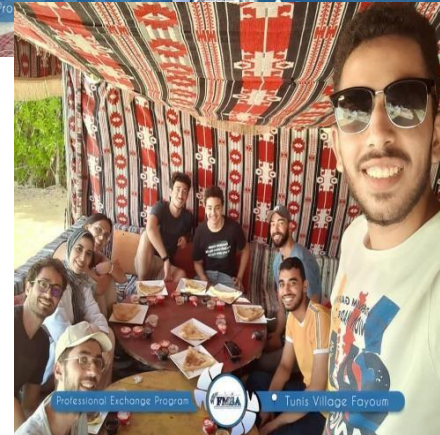
قرية تونس الفيوم