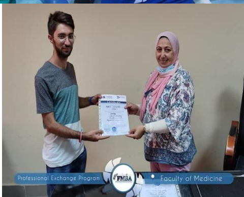
تسليم شهادات التدريب