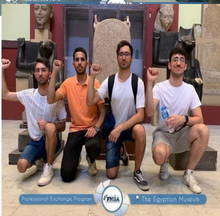
المتحف المصري القاهرة