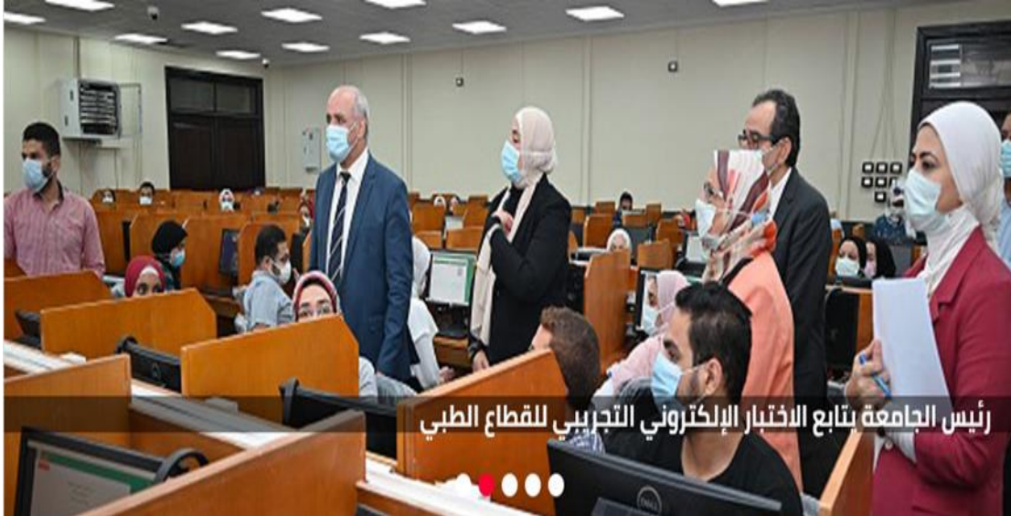
رئيس الجامعة يتابع الاختبار الإلكتروني التجريبي للطبي